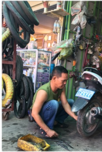
Yksi naula taas poistettu mopon renkaasta...