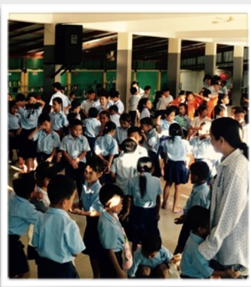
Vierailu Salamomin kouluun