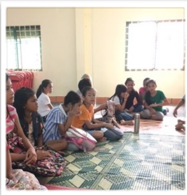
Pyhäkoulussa saimme tutustua seurakunnan lapsiin